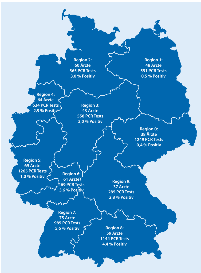
Abb. 1 ▲ Verteilung der 557 teilnehmenden Kinder- und Jugendärzte nach Postleitzahlenregion. Insgesamt 7707 Tests, davon 198 (2,6%) positiv. Lediglich 3 Kollegen mit insgesamt 12 Testungen, davon 1 positiver Test, gaben die ersten 3 Ziffern ihrer Postleitzahl nicht an

dar. Bei durchschnittlich 1200 Kindern und Jugendlichen pro Praxis betreuen diese 557 KJÄ ca. 0,67 Mio. Kinder und Jugendliche.